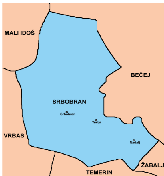
Слика 1. Положај општине Србобран

Општину чине три насеља: Србобран, највеће урбано насеље и насеља Турија и Надаљ, која су сеоског типа. Кроз Србобран пролази Велики бачки канал, тако да насеље већим делом лежи на левој, а мањим на десној обали канала. Општину са севера и истока омеђује река Криваја која се својим током даље улива у Велики бачки канал 3 (Слика 1). Са аспекта геоморфологије, општину чине две просторне целине. Прву чини виша лесна заван рапчлањена речицом Кривајом северно од Великог бачког канала и нижа лесна тераса која је лоцирана јужно од Великог бачког канала. Педолошки састав земљишта је такав да преовладава чернозем и ливадска црница. Површинске воде чине Велики бачки канал, речица Криваја и Бељанска бара.